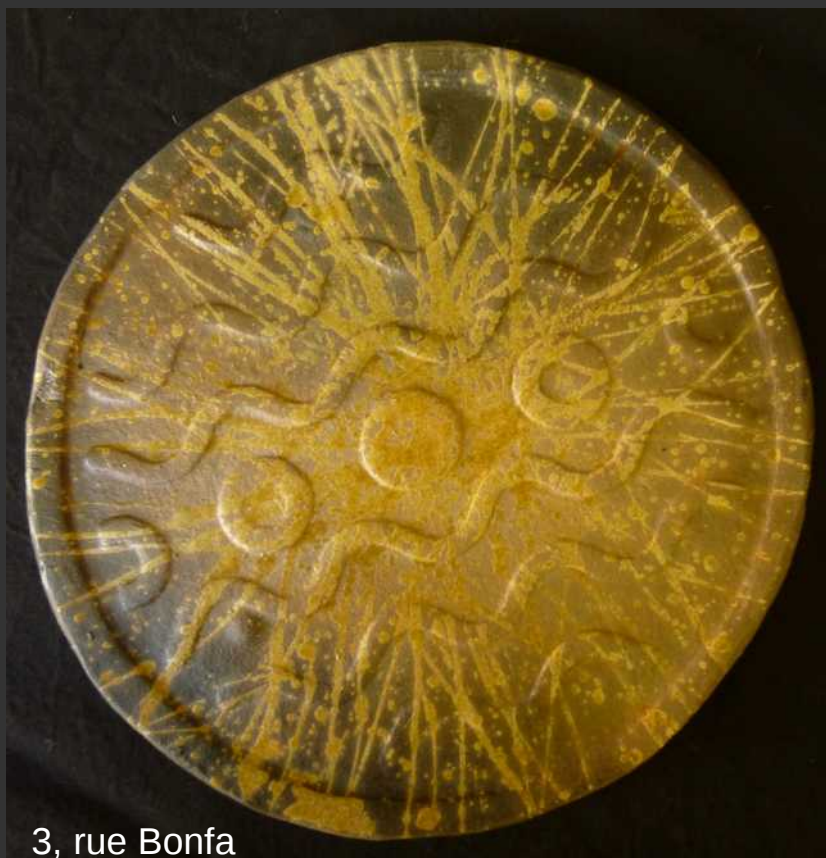
3, rue Bonfa