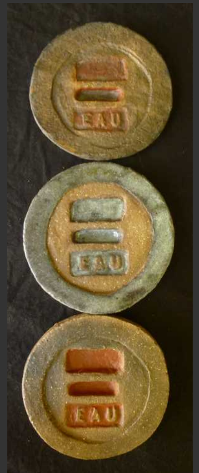
7, rue du Crémat