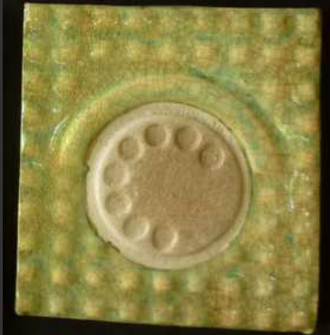
5 rue Bonfa